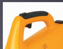
COMMUTATEUR MODE TURBO/MAX/ECO