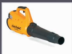
FOURNI AVEC BUSE LARGE, ETROITE ET GRATTOIR