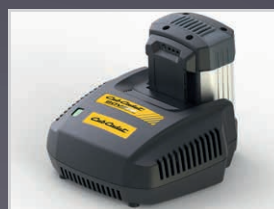
BATTERIE & CHARGEUR EN OPTION