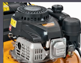
MOTEUR PUISSANT OHV CUB CADET