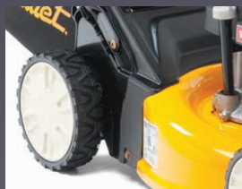
ROULEMENTS À BILLES DOUBLES