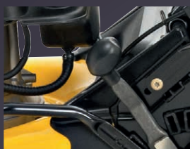
RÉGLAGE CENTRALISÉ DE LA HAUTEUR DE COUPE