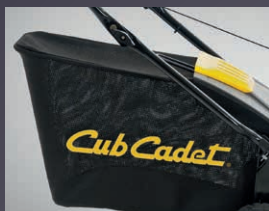
GRAND BAC DE RAMASSAGE