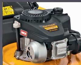
MOTEUR PUISSANT OHV CUB CADET