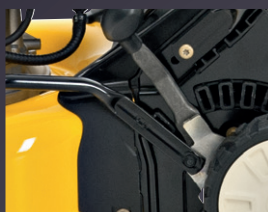
RÉGLAGE SEMI-CENTRALISÉ DE LA HAUTEUR DE COUPE