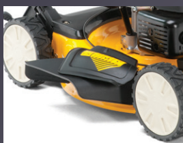
ROULEMENTS À BILLES DOUBLES