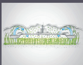
EXCELLENTE FONCTION MULCHING