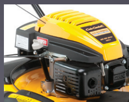
MOTEUR PUISSANT OHV CUB CADET