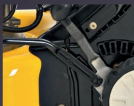
RÉGLAGE CENTRALISÉ DE LA HAUTEUR DE COUPE