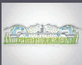
EXCELLENTE FONCTION MULCHING