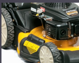
ROULEMENTS À BILLES DOUBLES