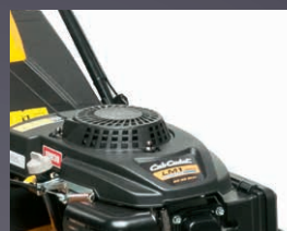
MOTEUR PUISSANT OHV CUB CADET