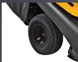
LARGES PNEUS SPÉCIAL GAZON