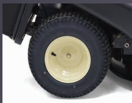
LARGES PNEUS SPÉCIAL GAZON