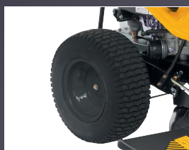
LARGES PNEUS SPÉCIAL GAZON