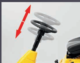
COLONNE DE DIRECTION RÉGLABLE