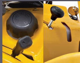
RÉSERVOIR GRANDE CAPACITÉ AVEC TÉMOIN