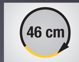
RAYON DE BRAQUAGE COURT