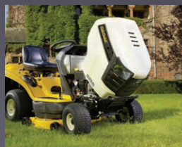
CAPOT MONOBLOC PIVOTANT