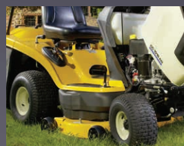
CAPOT MONOBLOC PIVOTANT