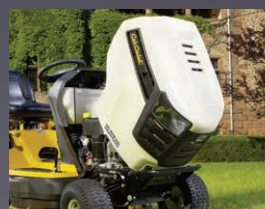
CAPOT MONOBLOC PIVOTANT