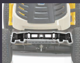
TRAIN AVANT PIVOTANT EN FONTE