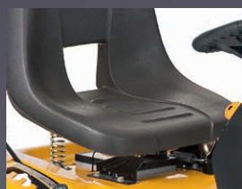
SIÈGE HAUT AJUSTABLE