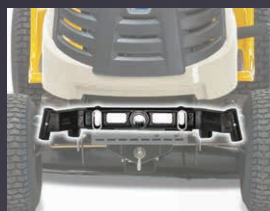
TRAIN AVANT PIVOTANT EN FONTE