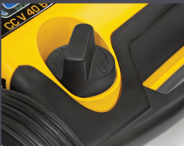
RÉGLAGE DE LA HAUTEUR DE TRAVAIL