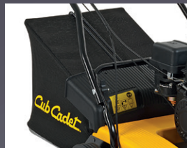
BAC DE RAMASSAGE (EN OPTION)