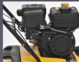
MOTEUR PUISSANT CUB CADET