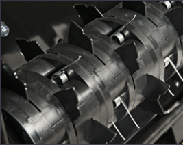
COUTEAUX DOUBLES ET GRIFFES