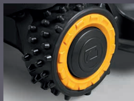
ROUES À PICOTS