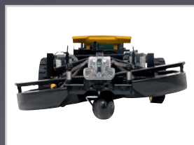
CARTER DE COUPE FLOTTANT