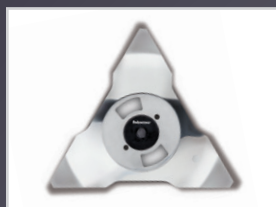
LAME ROBUSTE EN ACIER