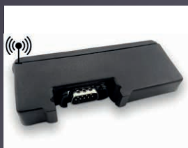
MODULE ROBOCONNECT (GSM)