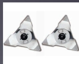
DOUBLE LAMES ACIER