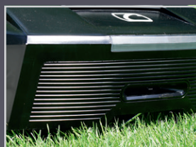
PARE CHOCS ULTRA-ROBUSTE