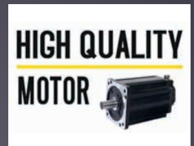
MOTEUR AVANCEMENT ET COUPE CONÇU POUR LA VIE DU PRODUIT