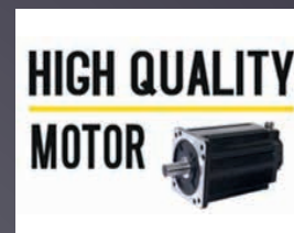
MOTEUR AVANCEMENT ET COUPE CONÇU POUR LA VIE DU PRODUIT