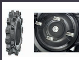
ROUES ET PLATEAU DE COUPE AUTONETTOYANT