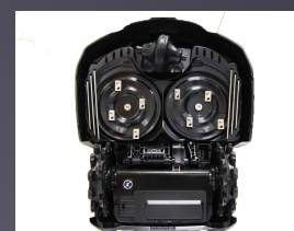
DOUBLE PLATEAU DE COUPE