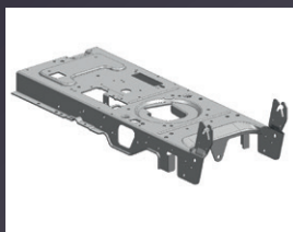
CHÂSSIS EN ACIER MECANO-SOUDÉ