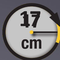
RAYON DE BRAQUAGE ULTRA COURT