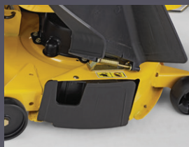
OBTURATEUR MULCHING INCLUS