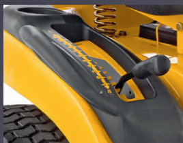
HAUTEUR DE COUPE 12 POSITIONS