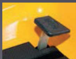
BLOCAGE DE DIFFÉRENTIEL