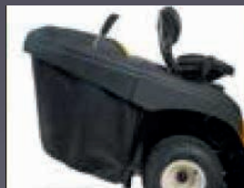
LEVIER DE BAC ESCAMOTABLE