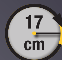
RAYON DE BRAQUAGE ULTRA COURT