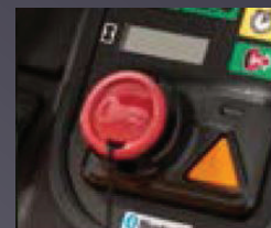
DÉMARRAGE SANS CLÉ