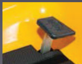
BLOCAGE DE DIFFÉRENTIEL