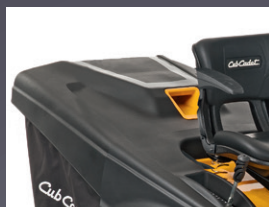
RELEVAGE ÉLECTRIQUE DU BAC