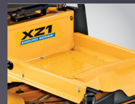
LARGE ESPACE POUR LES JAMBES