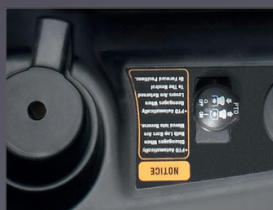
EMBAYAGE ÉLECTRO MAGNÉTIQUE DES LAMES