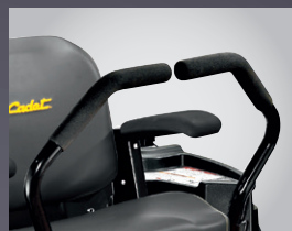
MANETTES CONFORT ACCOUDOIRS DE SIEGE