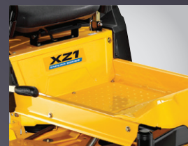
LARGE ESPACE POUR LES JAMBES