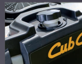
RÉSERVOIR GRANDE CAPACITÉ