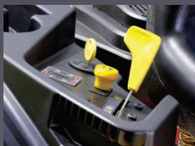
EMBRAYAGE ÉLECTRO MAGNÉTIQUE DES LAMES