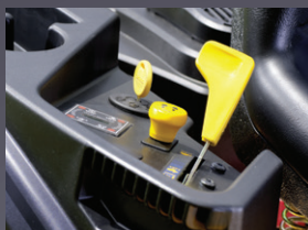
EMBRAYAGE ÉLECTRO MAGNÉTIQUE DES LAMES