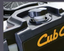
RÉSERVOIR GRANDE CAPACITÉ