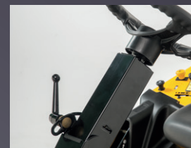
COLONNE DE DIRECTION AJUSTABLE