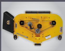
PLATEAU DE COUPE MÉCANO-SOUDÉ