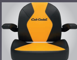
GRAND SIEGE CONFORT AVEC ACCOUDOIRS