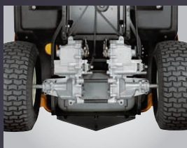
DOUBLE TRANSMISSION HYDROSTATIQUE