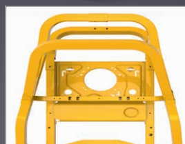
CHÂSSIS TUBULAIRE 38X76 MM