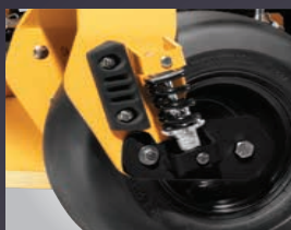
ROUES AVANT AMORTIES