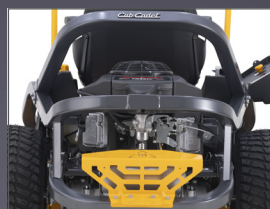
CHÂSSIS TUBULAIRE 50X50 MM