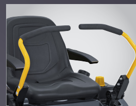
LEVIERS AVEC GRIP SOFT TOUCH ANTI-VIBRATION