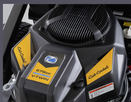
MOTEUR CUB CADET BICYLINDRE