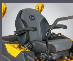
SIÈGE À ACCOUDOIRS ET DOSSERET HAUT