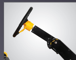
COLONNE DE DIRECTION AJUSTABLE