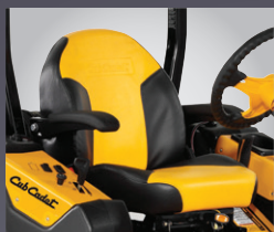
SIÈGE À ACCOUDOIRS ET DOSSERET HAUT