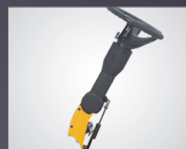
COLONNE DE DIRECTION AJUSTABLE