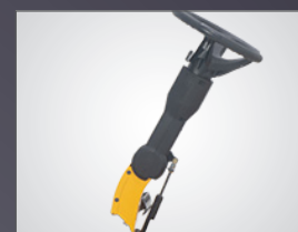
COLONNE DE DIRECTION AJUSTABLE