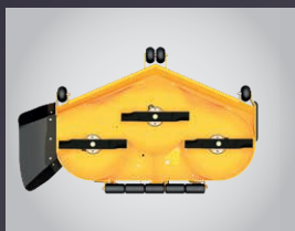
PLUS GRAND PLATEAU DE COUPE DU MARCHÉ