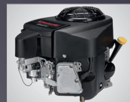
MOTEUR KAWASAKI 999 CM3