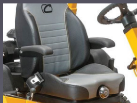
SIÈGE À ACCOUDOIRS ET DOSSERET HAUT