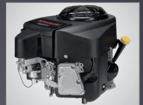
MOTEUR KAWASAKI 999 CM3