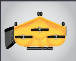
PLUS GRAND PLATEAU DE COUPE DU MARCHÉ